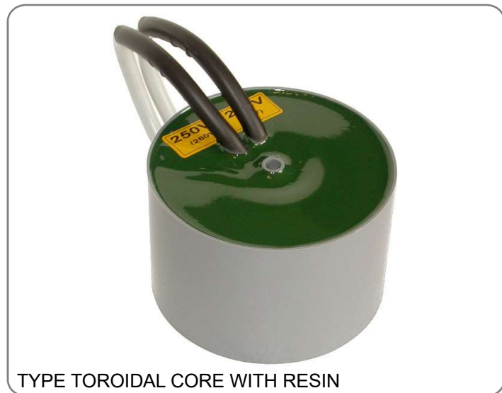
TYPE TOROIDAL CORE WITH RESIN